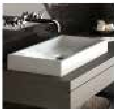
Color: GRANIT | Dimensioni: 160x70x45 cm