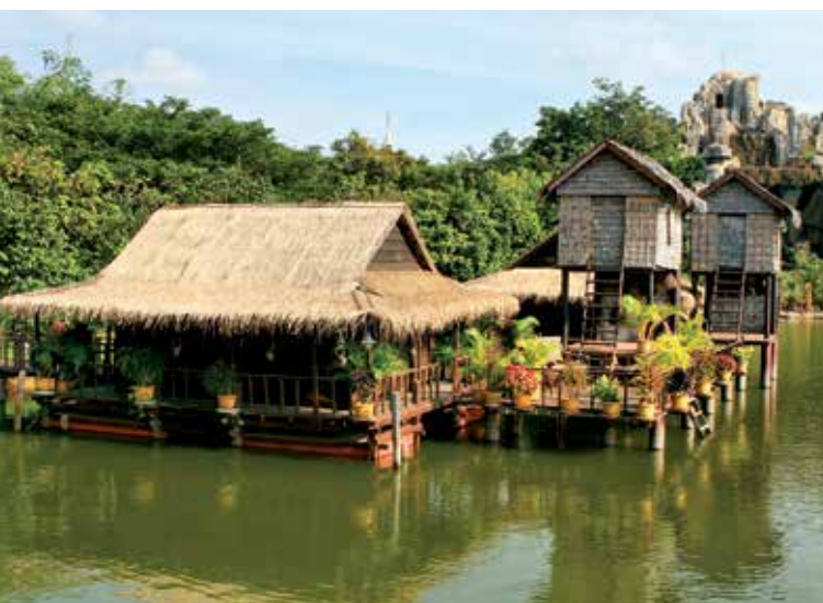
Integración con la naturaleza, requisito del turismo ecológico