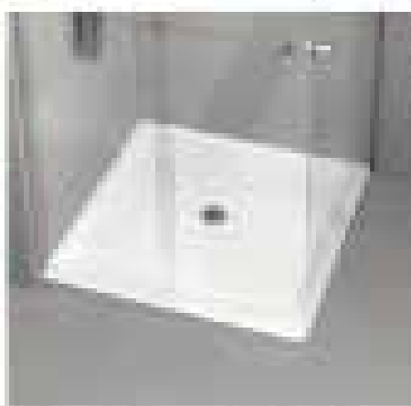
Color: ALU | Dimensioni: 160x70x45 cm