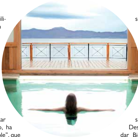
Vistas desde el spa del hotel Los Cauquenes, Argentina

Avalar la validez y los resultados de la política ambiental puesta en marcha es el pilar fundamental para ganar más clientes y obtener más ingresos. Discriminar aquellos títulos que más