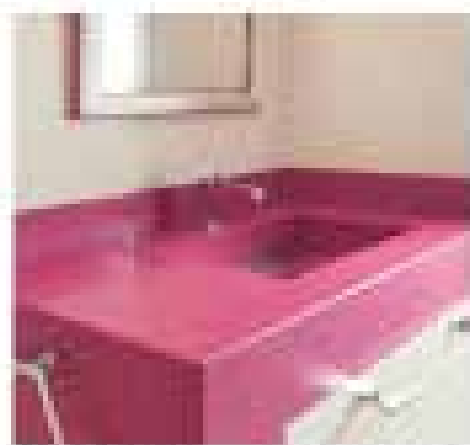
Color: REDFISH | Dimensioni: 160x70x45 cm

La Algebra è una serie di prodotti bambini, in formato bidone e cassetto a 40 cm di altezza, per ogni possibile utilizzo.